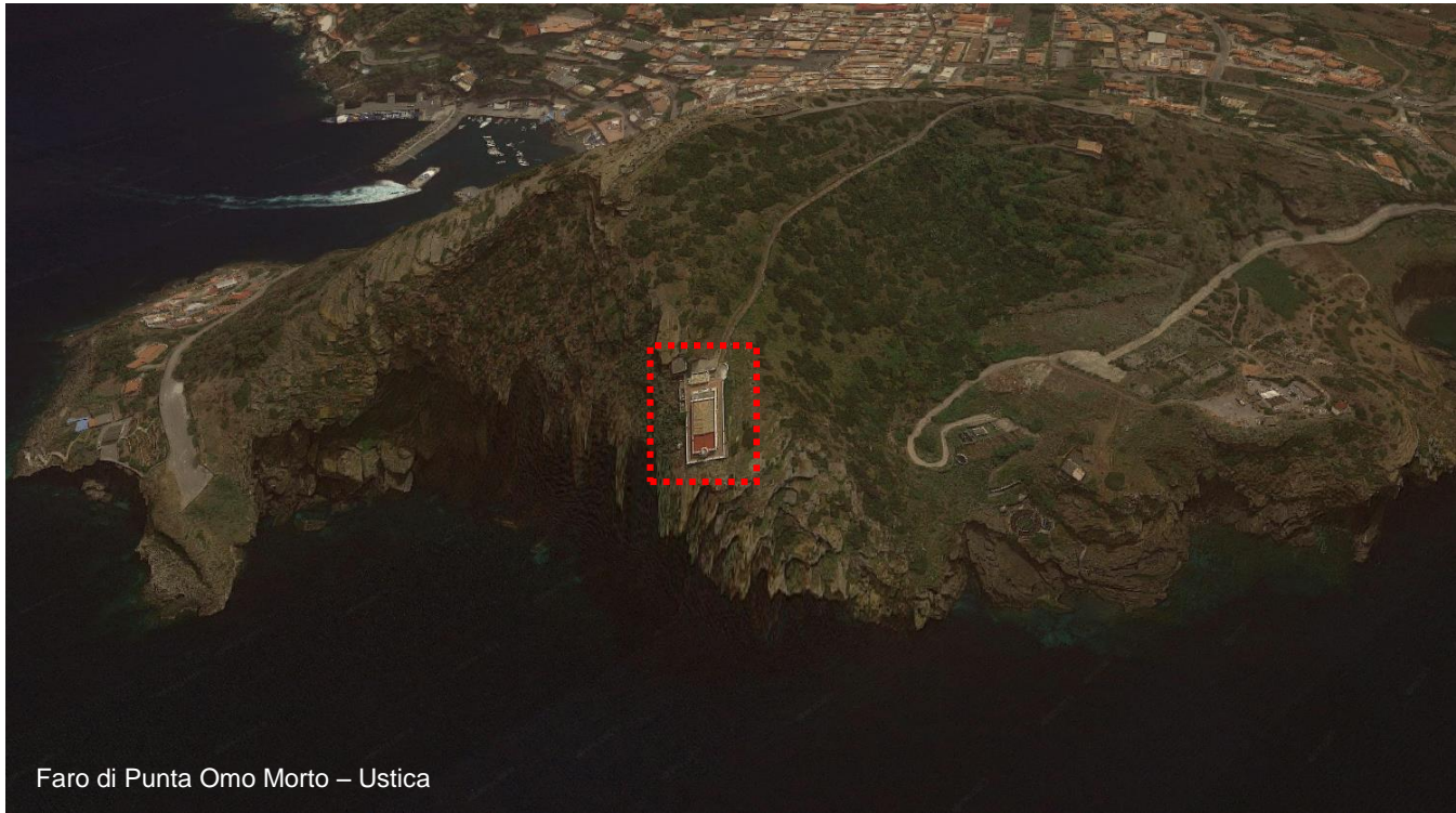
Faro di Punta Omo Morto – Ustica