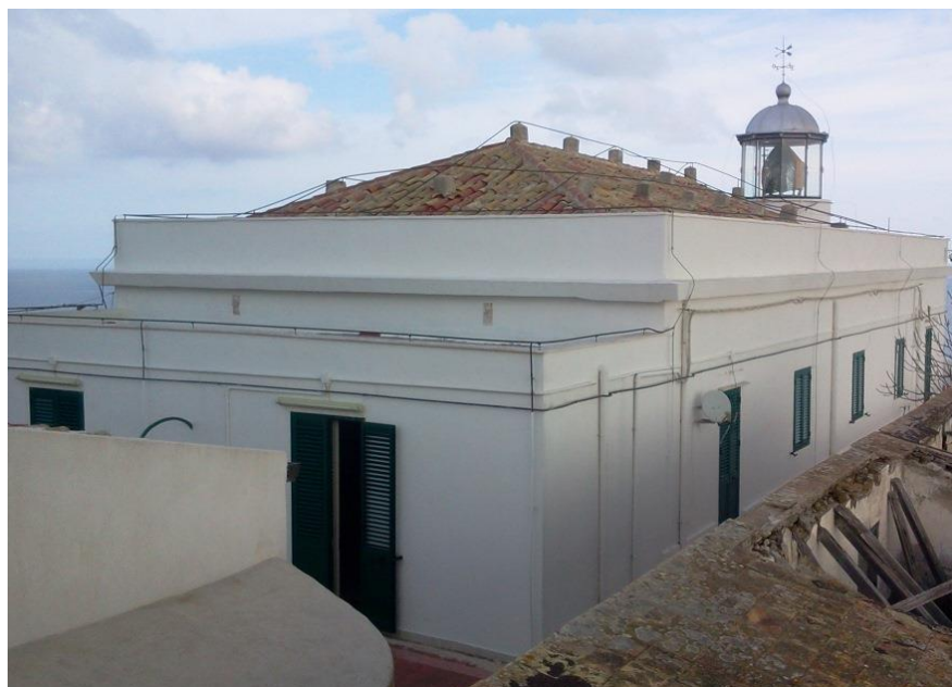
Lotto 8 - Faro di Punta Omo Morto Isola di Ustica (PA)