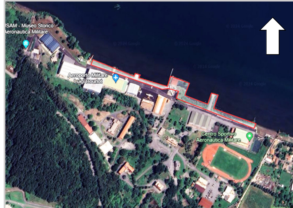
Ortofoto 2d del sedime da valorizzare