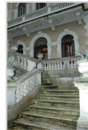
Foto varie di Villa «Bonci» e delle aree e dei manufatti/aree di pertinenza