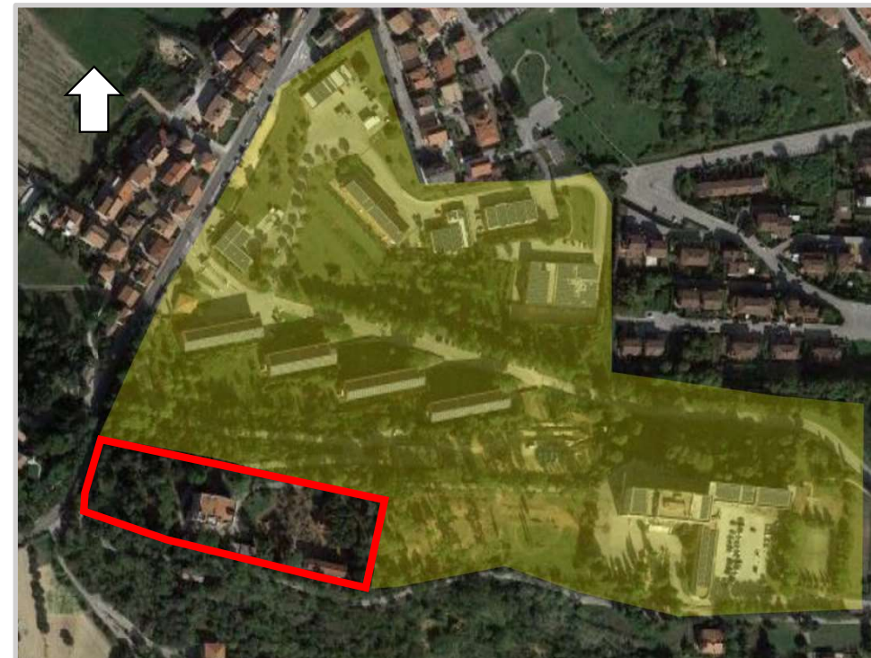
Ortofoto 2d con indicata, in contorno rosso, l'aliquota da valorizzare