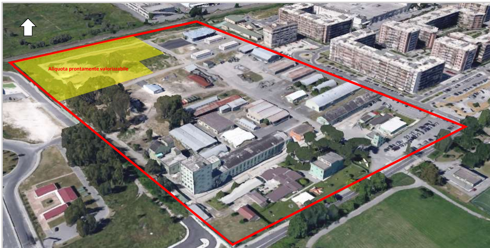
Ortofoto 3d del sedime oggetto di valorizzazione