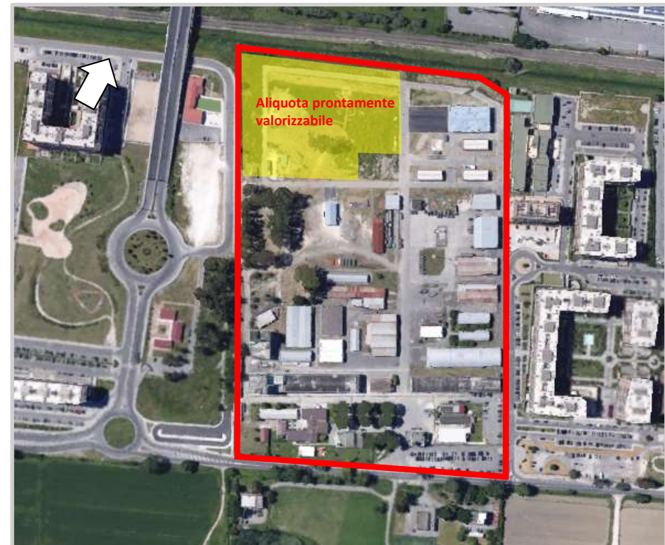
Ortofoto 2d del sedime da valorizzare