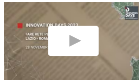
La diretta Innovation Days Lazio 2023