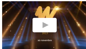
La diretta Women at the Top - Summit 2023