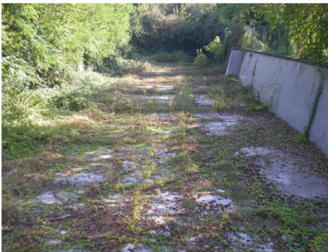
VASCA CONTENIMENTO DEPOSITO POL