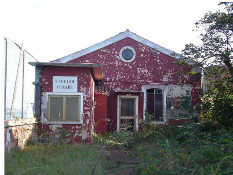
FABBRICATI DEPOSITO POL