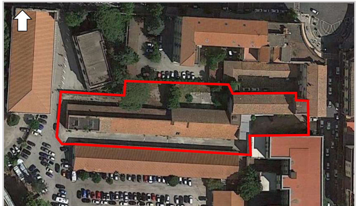
Ortofoto 2d del sedime da valorizzare