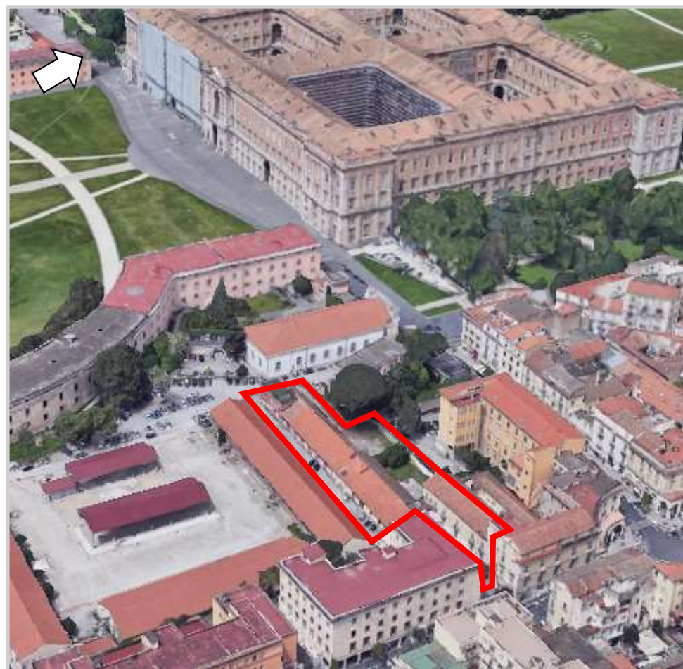
Ortofoto 3d del sedime da valorizzare (lato est)