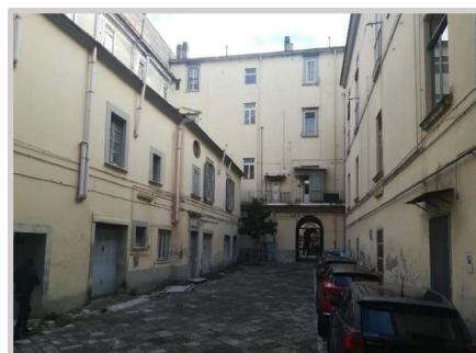
Foto di alcuni manufatti