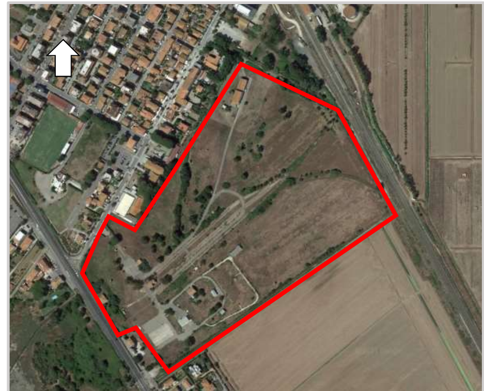
Ortofoto 2d del compendio da valorizzare