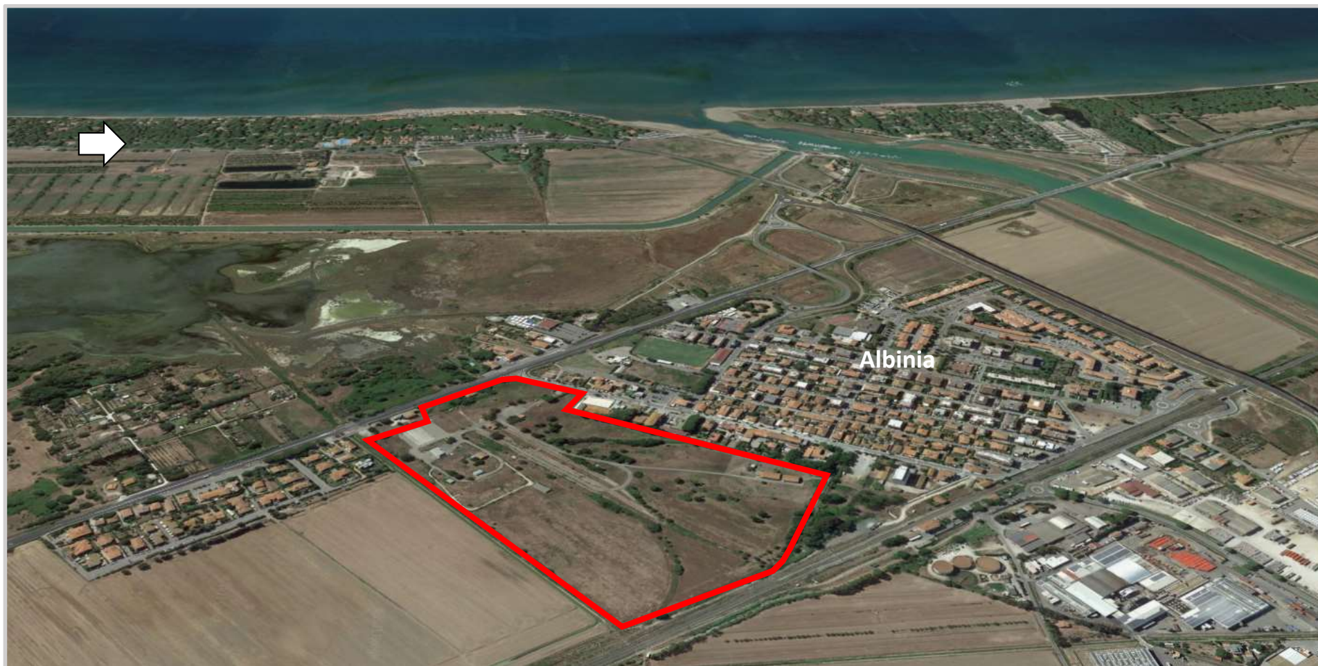
Ortofoto 3d del compendio da valorizzare

Destinazione d'uso futura: sportiva/ricreativa