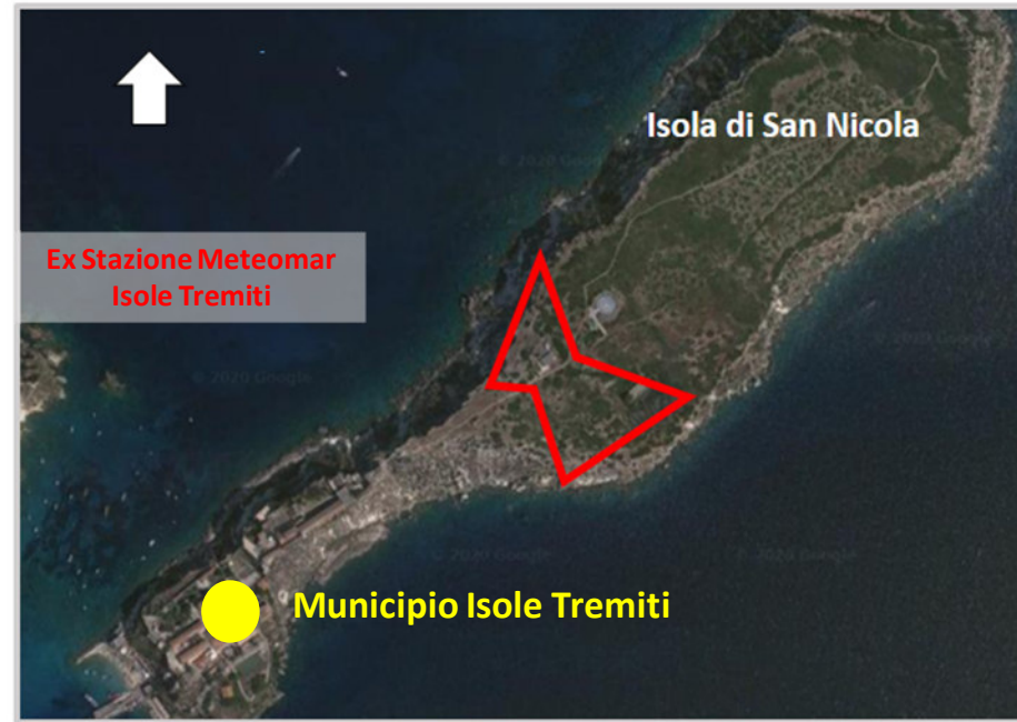
Ortofoto 2d del sedime da valorizzare