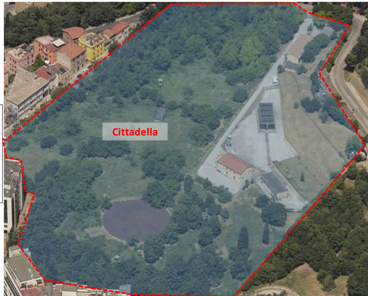
Compensorio Cittadella – 2x11.000 mc (Gasolio) – 4x500 mc (Kerosene)

Nel sedime ha inoltre sede, seppur in area enucleata, una palazzina alloggi con tre ASI ed un ASGC.