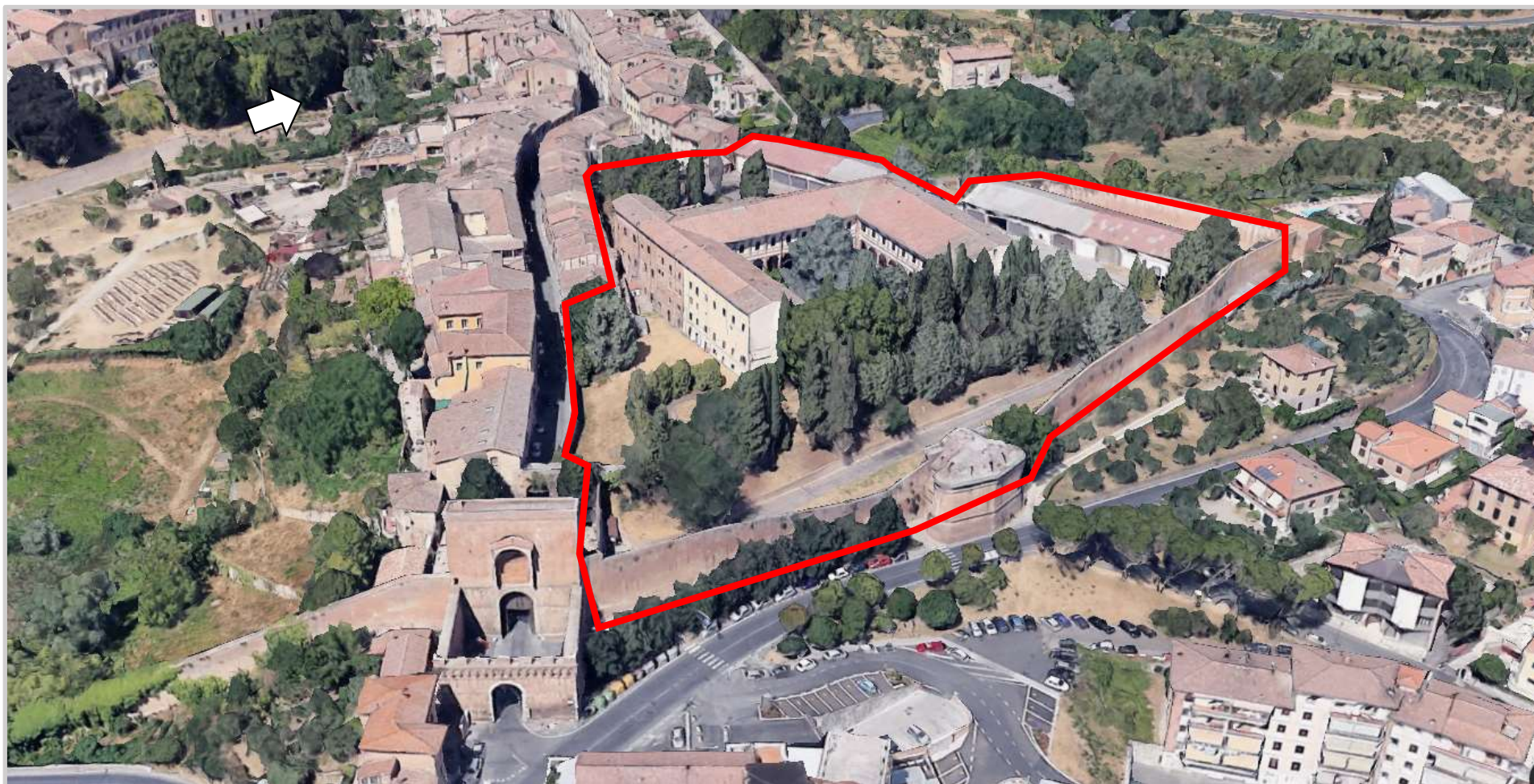
Ortofoto 3d del sedime da valorizzare

Destinazione d'uso futura: turistico-ricettiva