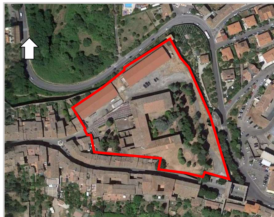
Ortofoto 2d del sedime da valorizzare