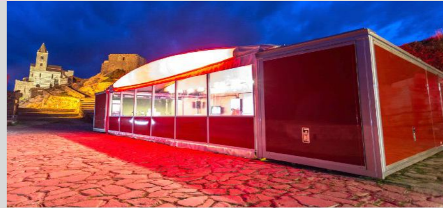
Hospitality House Dedicata ai partner