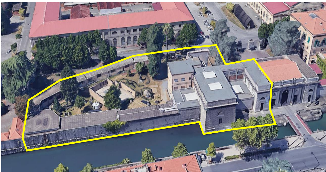
Obliqua 3d del sedime da valorizzare