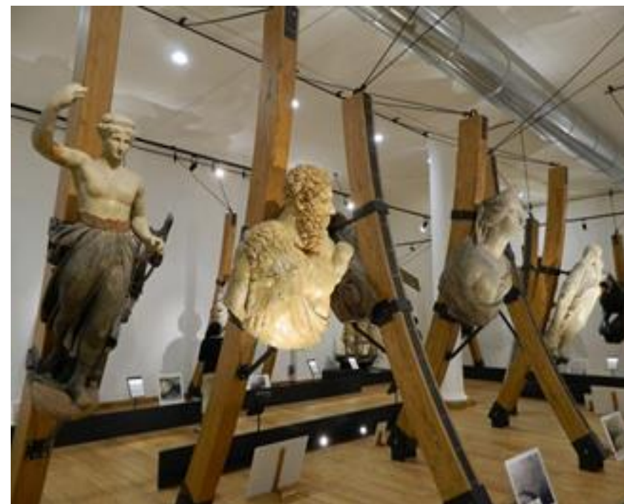
Sala delle polene