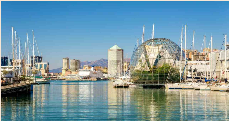
▲ (Leonid Andronov - stock.adobe.com)