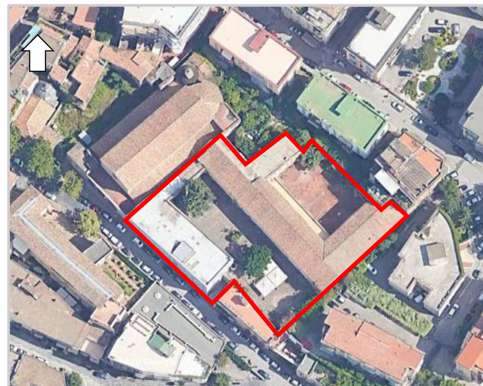
Ortofoto 2d del sedime da valorizzare