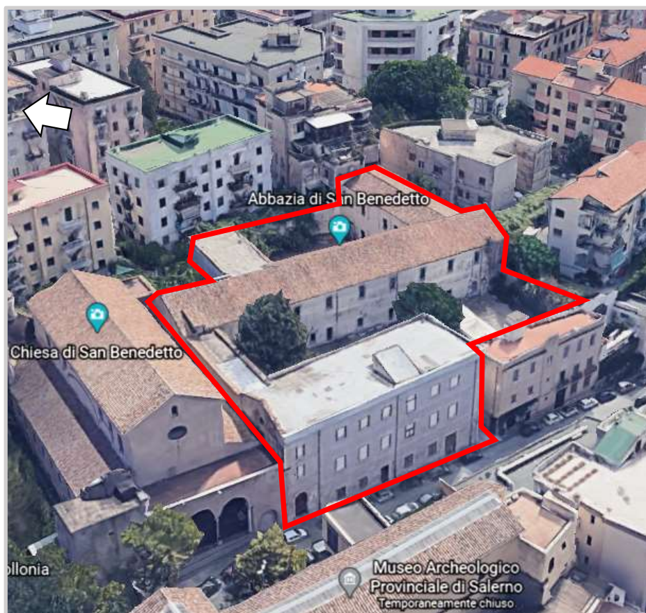
Ortofoto 3d del sedime da valorizzare

Destinazione d'uso futura: turistico-ricettiva/ senior housing