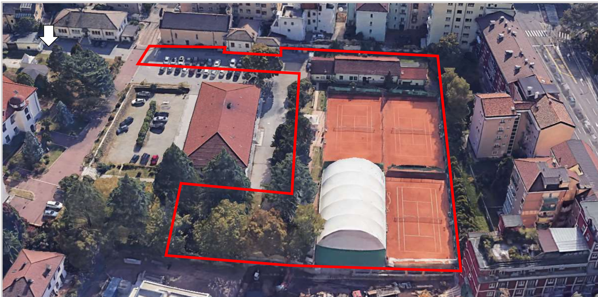
Ortofoto 3d del sedime da valorizzare

Destinazione d'uso futura: sportiva/ricreativa