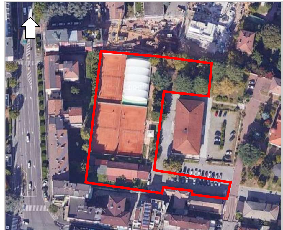
Ortofoto 2d del sedime da valorizzare