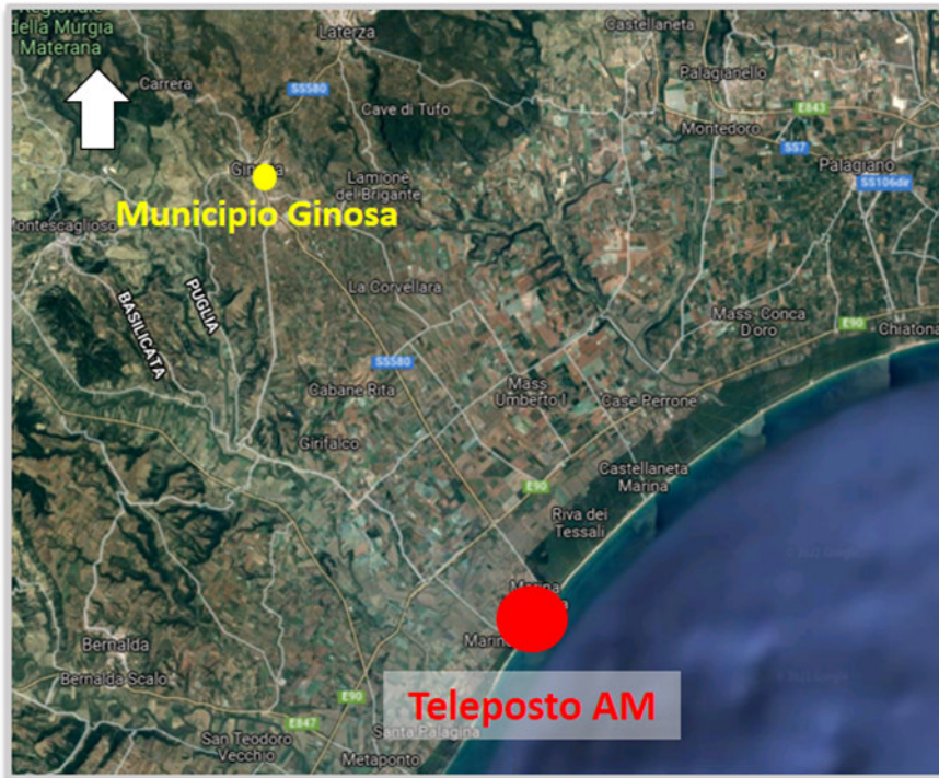
Inquadramento geografico in ambito comunale