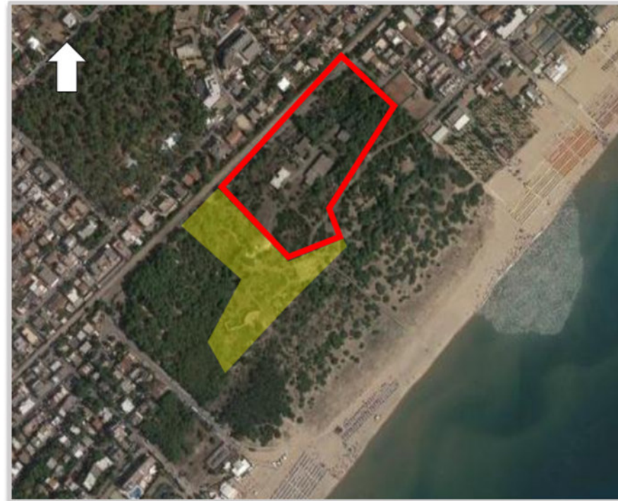
Ortofoto 2d del sedime da valorizzare