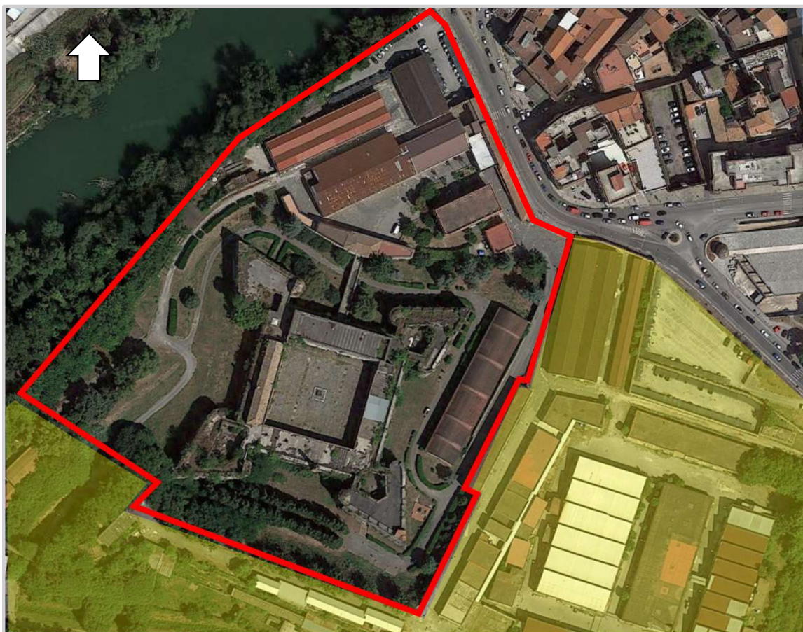
Ortofoto 2d con indicata, in contorno rosso, l'aliquota di sedime da valorizzare

Destinazione d'uso futura: turistico-ricettiva