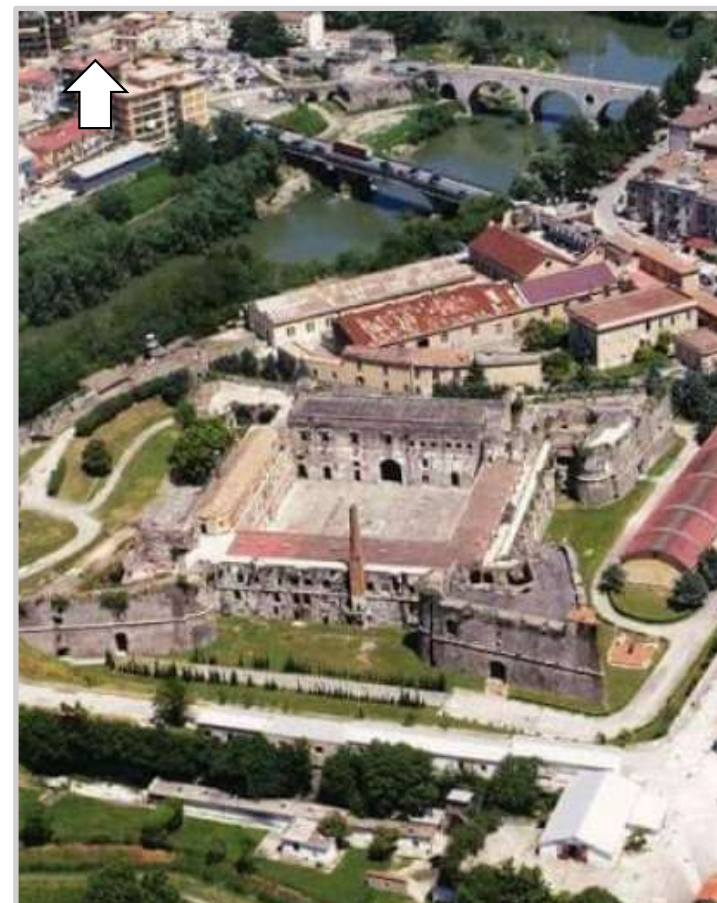
Ortofoto 3d del Castello di «Carlo V»