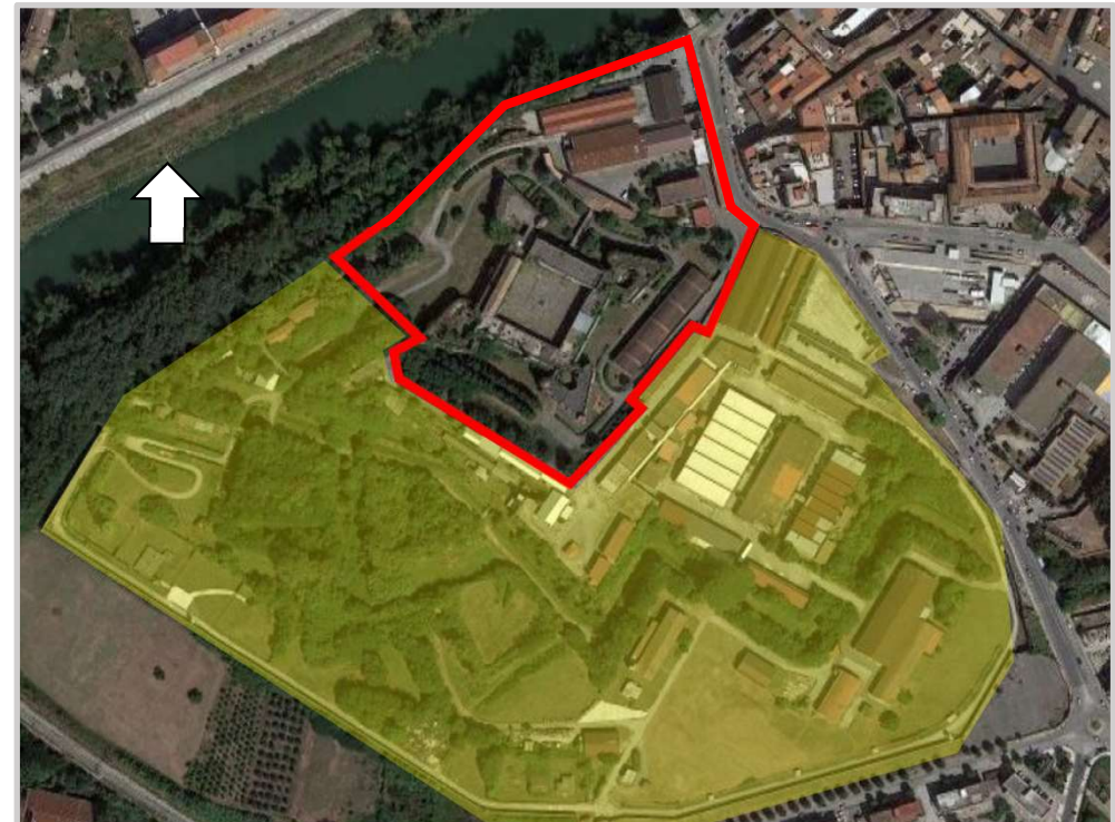
Ortofoto 2d con indicata, in contorno rosso, l'aliquota di sedime da valorizzare